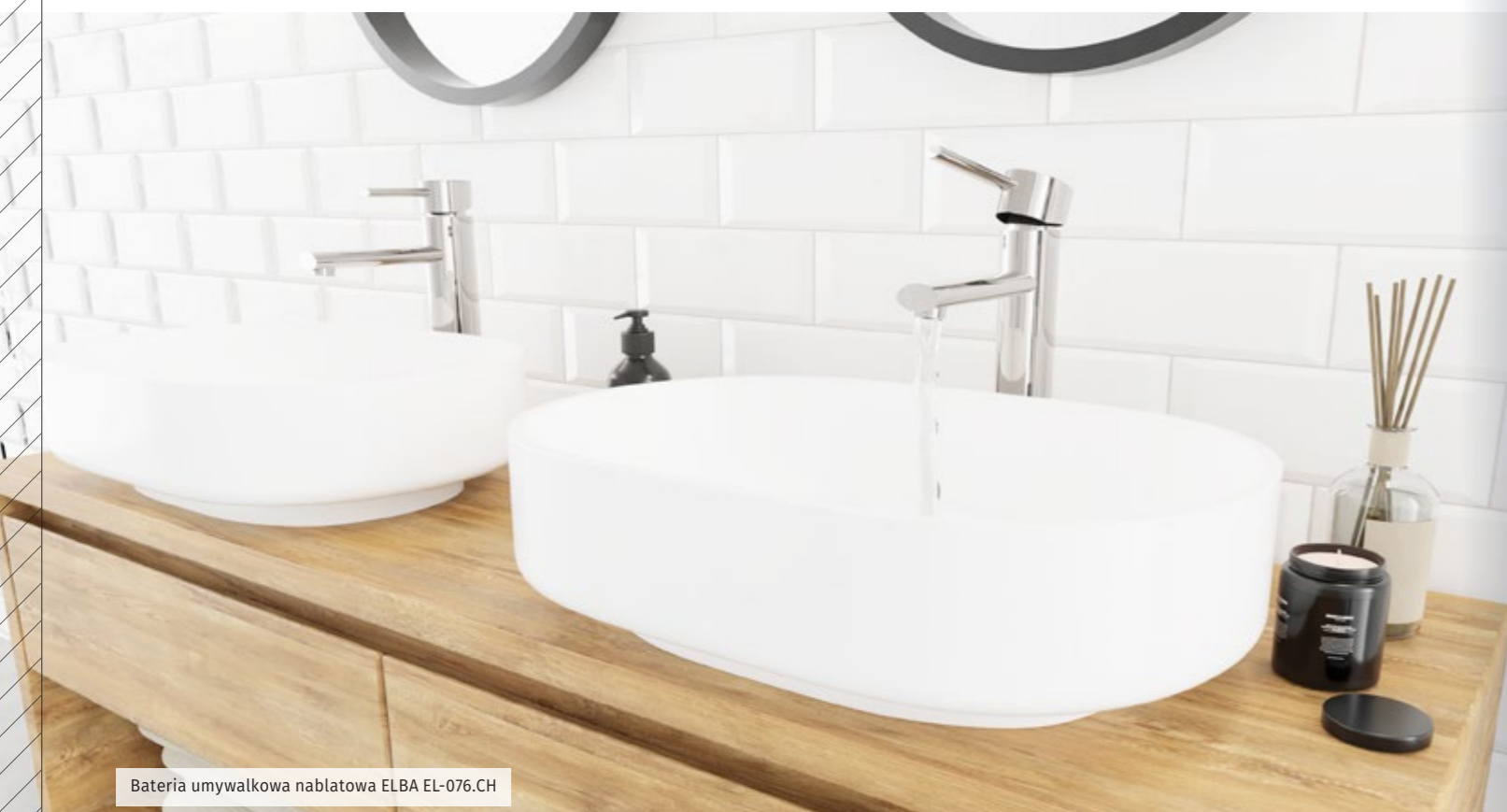
Bateria umywalkowa nablatowa ELBA EL-076.CH

Wszystkie produkty DIAMOND mają atest PZH gwarantujący bezpieczeństwo wyrobu w kontakcie z wodą przeznaczoną do spożycia przez ludzi i spełniają wszelkie obowiązujące normy – w tym potwierdzające dopuszczenie do obrotu i powszechnego stosowania w budownictwie (znak budowlany).