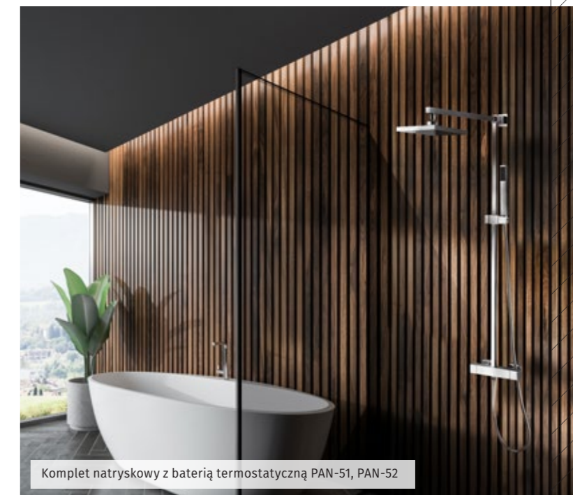
Komplet natryskowy z baterią termostatyczną PAN-51, PAN-52