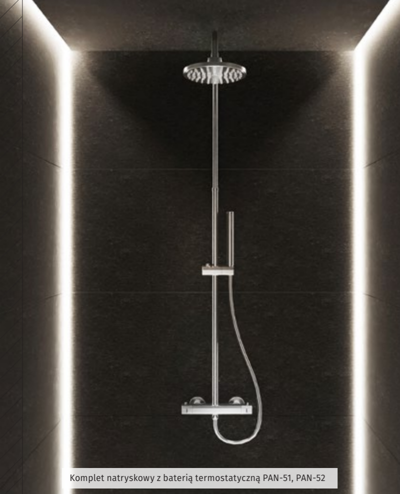
Komplet natryskowy z baterią termostatyczną PAN-51, PAN-52