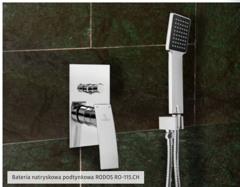
Bateria natryskowa podtynkowa RODOS RO-115.CH