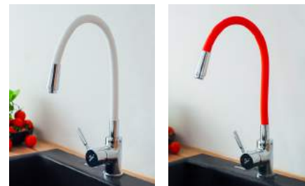
BATERIA KING – DOSTĘPNA W TRZECH KOLORACH: CZARNY, BIAŁY I CZERWONY. PROPONUJEMY RÓWNIEŻ WYLEWKI W KOLORACH: POMARAŃCZOWY, SZARY, NIEBIESKI, ZIELONY.