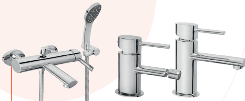
SERIA ELBA – NOWOCZESNA LINIA FUNKCJONALNYCH BATERII KUCHENNYCH I ŁAZIENKOWYCH NALEŻĄCA DO KLASY PREMIUM. KOMPLETUJ BATERIE W SWOIM DOMU WEDŁUG TEJ SAMEJ SERII.

Warto również zwrócić uwagę na armaturę o artystycznej formie, przygotowaną z myślą o najbardziej wymagających klientach. Takie oryginalne kształty na pewno odnajdą się w wielu wnętrzach. Mogą nawet okazać się ich najbardziej charakterystycznym elementem!